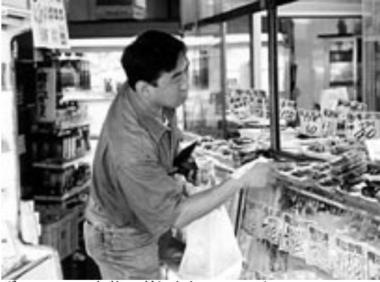
ボランティア名物の差し入れのコロッケで有名な塚本商店で買い物中のポストマン氏。表情に生活感が溢れる。