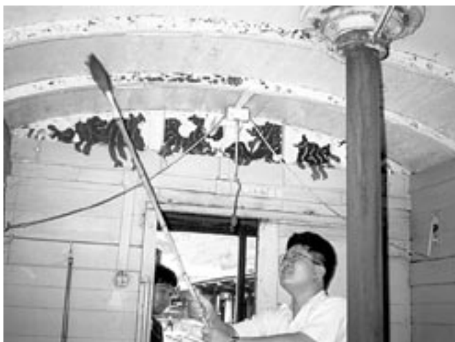
内部の整理をして、天井のほこりも落とす