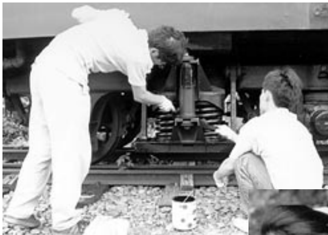
オハニの台車を丁寧に塗装する