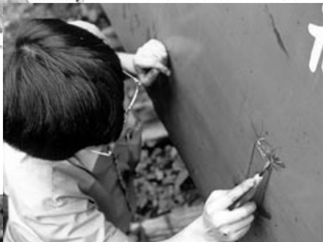
塗装が浮いた所は剥がしてから補修する