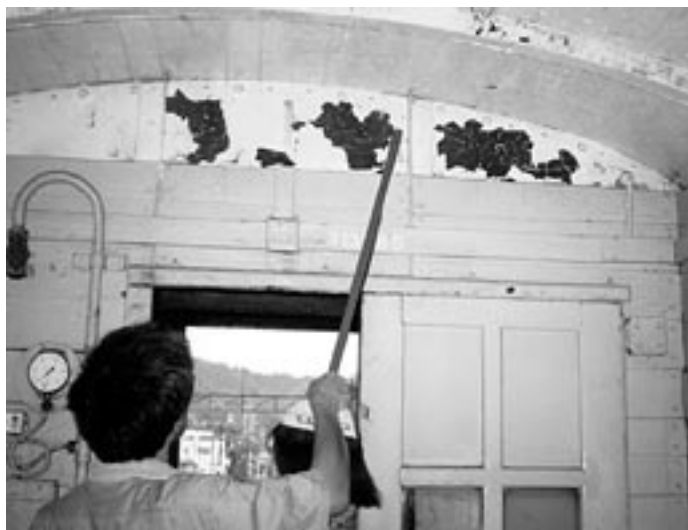
塗装の浮いているところを、たたいてチェック