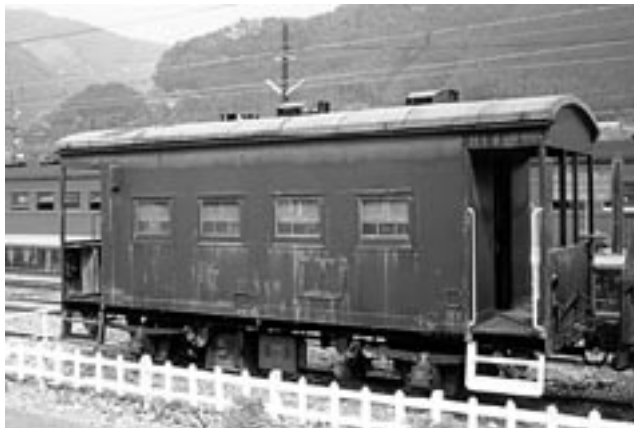
千頭駅構内に鎮座ましましているヨ5000。チョット疲れてる