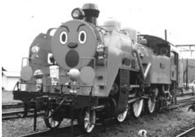
ジャーン!これがSLマンだ!!

定例会では活発に意見が出されており、トラストレイン運行の現場でも「もっとこんなふうにしていこう...」というような積極的な声が聞かれています。そういったサークルの現状をお伝えしていくことは当然ながら、一方通行的ではなく、日頃定例会やトラストレイン運転に参加できない方々の声も交換していけるような会報にしていきたいと思っていますので、ご協力をおねがいします。尚、当分の間はできるだけ発行回数を増やせる方向で進めていきたいと考えていますので、どうぞよろしくお願ひします。御意見、御要望があればドンドン出していただければ幸いです。