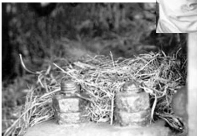
こんな所に鳥の巣の跡が..(どこだ?)