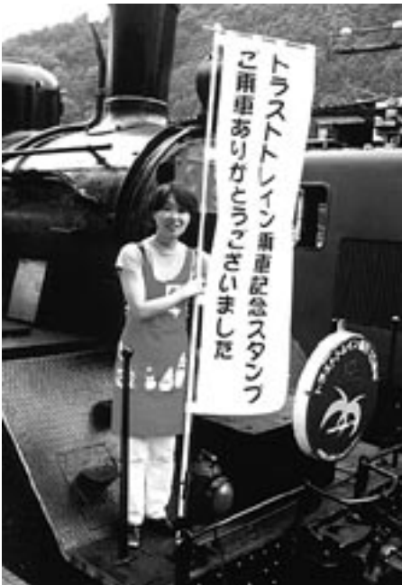
乗車記念スタンプの告知のために製作したノボリ。効果はバツグン。