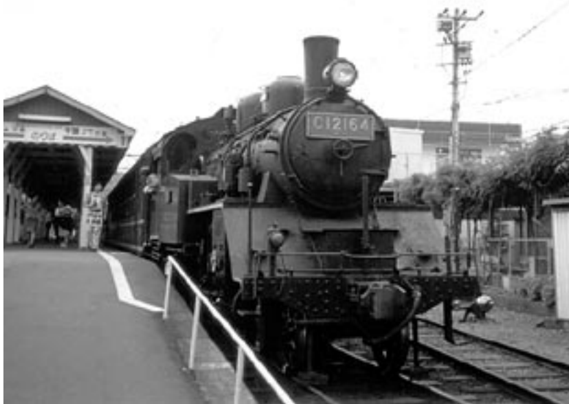
5月30日の運転はヘッドマーク無しで行われた