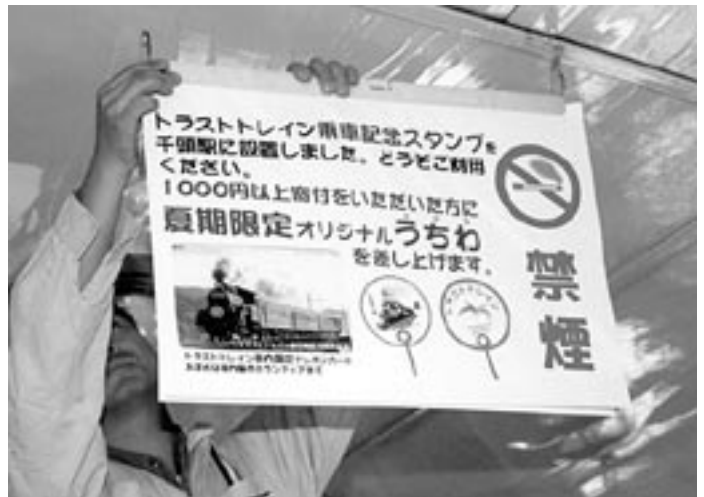
記念スタンプの告知とうちわプレゼントに合わせて車内の吊り広告も新調

18日の夜は焼津駅近くの札幌ビール園にてジンギスカンで1杯・2杯・3杯…。そのあと、宿泊班はとろける温泉を経て金谷の百楽園へ。