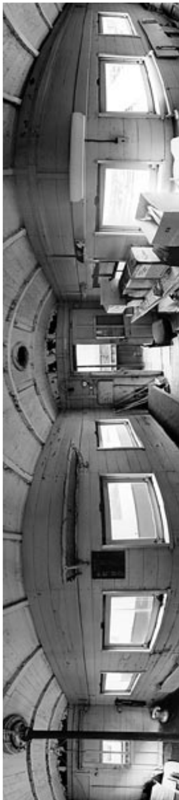
まっく田中特製ヨ5000内部パノラマ写真