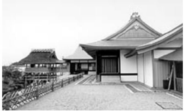
金谷駅近くの丘の上(牧ノ原台地)に最近造られた、お茶の博物館の中庭にある建物。ちなみに、遠山の金さんはいませんでした。