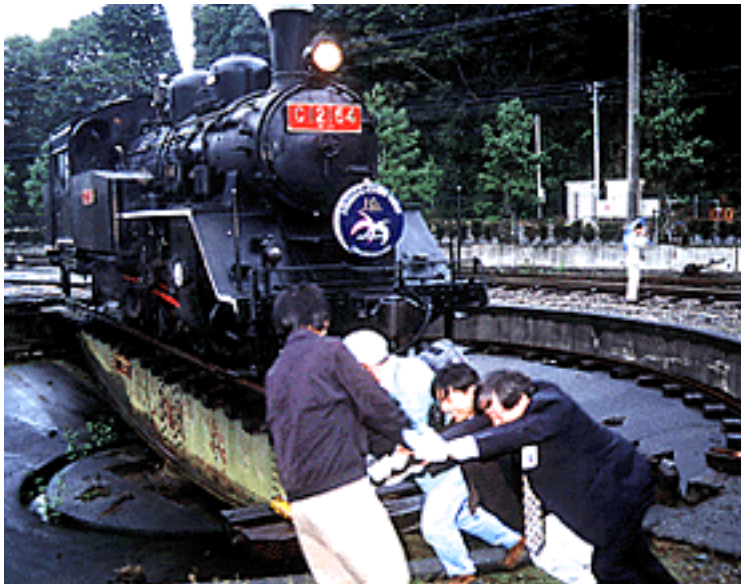
ひさびさにターンテーブルにのったC12を人力で回す。しかし、かなりの力が必要

千頭駅到着後はC12がターンテーブルに乗せられ、みんな で押して回すという一大イベント(!? )が行われたのである。