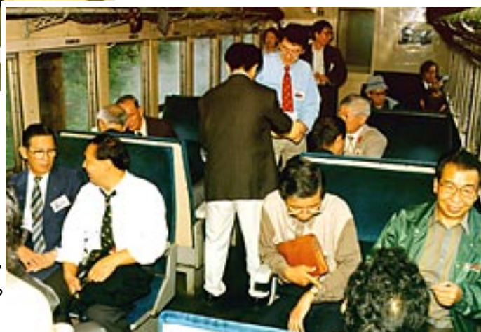
車内は専門委員や招待客の方々 なども乗車され、熱気は上がる

編成は当初、SL + 客車3両のオリジナル編成の予定であったが、団体の予約客が多かったため、スハフとオハニの間に1両増結された4両編成で、電機の後押しが付いた運転となった。