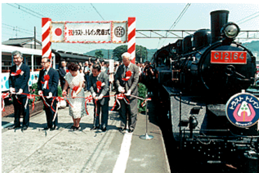
新金谷駅での記念式典の後、14時28分、記念すべき第1号列車は出発した。