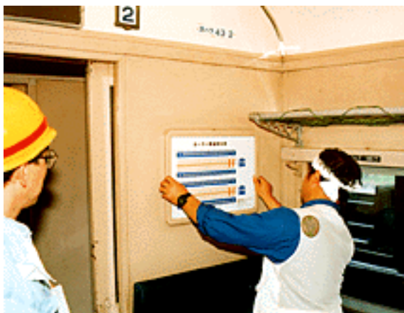
スハフの車内にカーテン募金者 の一覧表を取り付ける

10周年記念運転の日、そして新しくなったスハフ43のカーテンとオハニの白熱灯のお披露目でもある10月4日がやってきた。