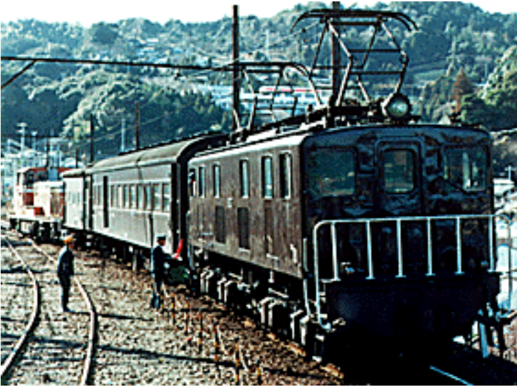
1986年1月14日、前日に山陰本線福知山から回送されて来たオハニ36が、東静岡からのヨ5000を待って、日本国有鉄道から大井川鉄道へと入線する