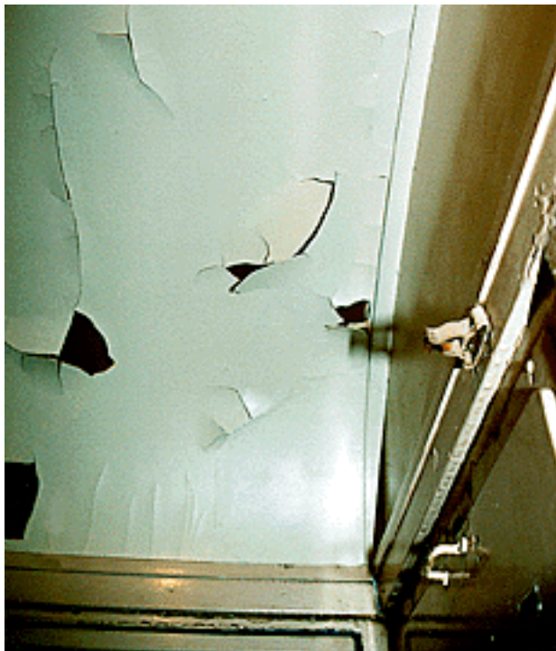
いまにも剥がれ落ちそうな スハフ43-3のデッキの天井部