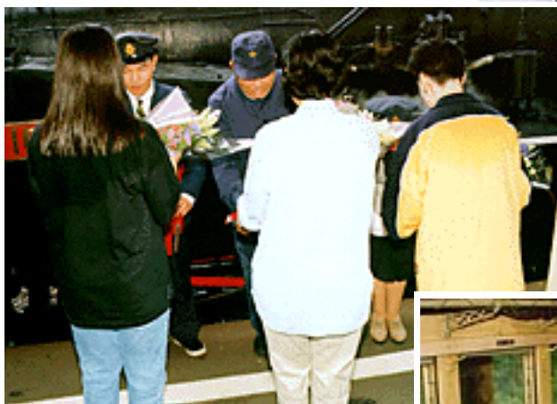
当日の参加者の中から選ばれた 女性陣が急遽花束贈呈の役に

編成は当初、SL + 客車3両のオリジナル編成の予定であったが、団体の予約客が多かったため、スハフとオハニの間に1両増結された4両編成で、電機の後押しが付いた運転となった。