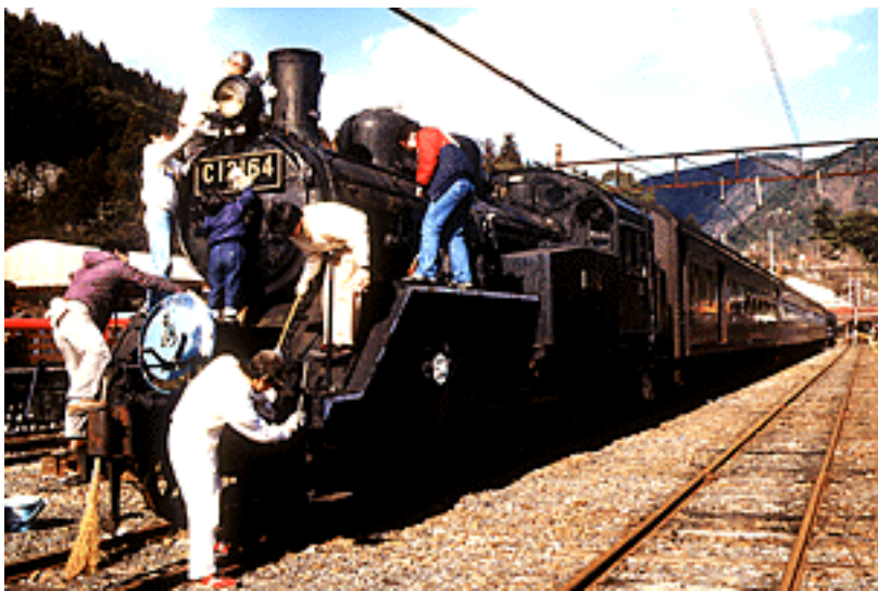
トラストトレインの全ての車輦が勢揃いし、その動き出す日を心待ちにしながら車体の清掃や補修を進める(1986年12月20日・千頭)