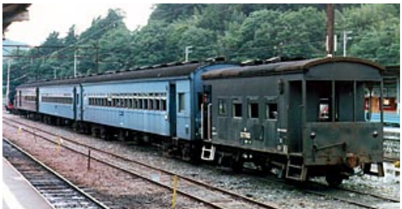
C12が修復作業のため新金谷に向かい、スハフ43・オハニ36も修復の日を待つ (1987年5月・千頭)