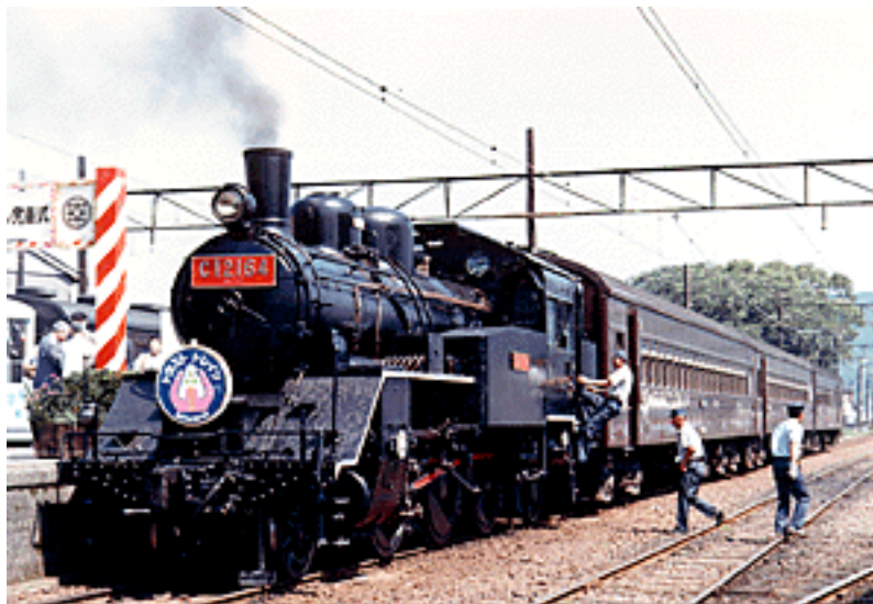
募金者など約300名にのぼる招待者を待ち受けるべく準備は進む