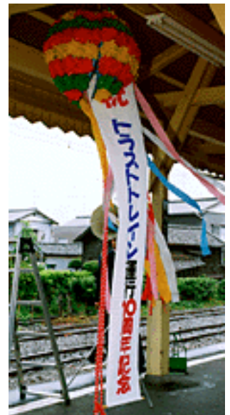
無事に割れた? Xす玉と 記念の垂れ幕