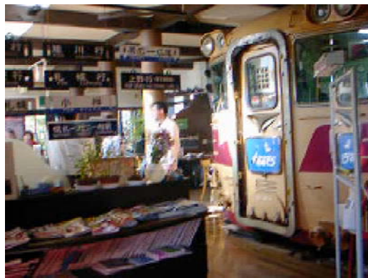
店内に鎮座するキハ58