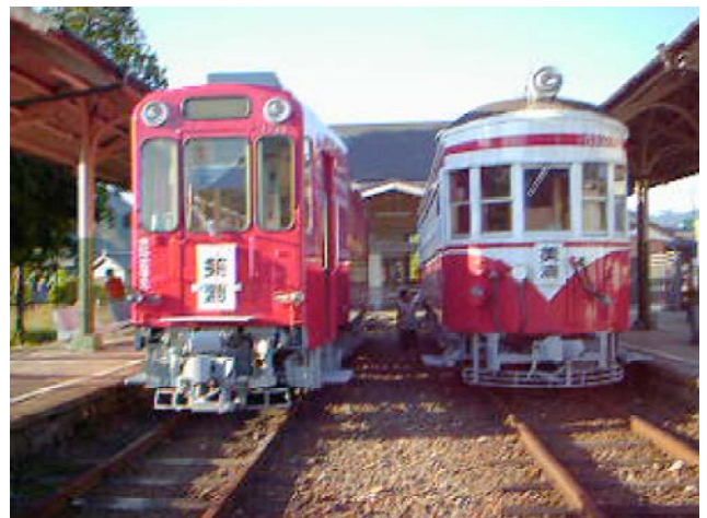
名鉄美濃町線保存車両